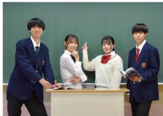
※甲子園出場時及びその他寄付金はありません。